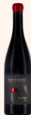
Villa Bys Vin rouge 75cl

Viandes blanches et rouges, canard et agneau