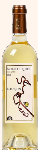
Amistat Vin blanc doux 75cl

A consommer avec vos desserts ou pour des apéritifs sucrés.