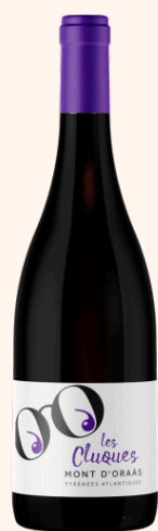
Les Cluques Vin rouge 75cl