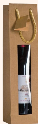
Poche 1 bouteille 1.35€ HT