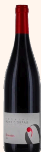
Hountas Vin rouge 75cl