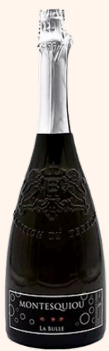
La Bulle brut Vin blanc sec ss sulfite 75cl

Idéal pour les apéritifs d'înatoires, les Fromages à pâtes persillés et le foie gras.