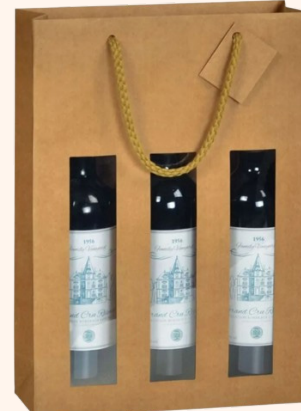
Poche 3 bouteilles 1.70€ HT

Profitez de -5% de remise pour toute commande passée avant le 4 novembre