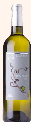
L'Estela Vin blanc sec 75cl

Situe a Monein, au cœur du Bearn, le Domaine Montesquiou est labellisé biologique. C'est un domaine familial, une passion qui se transmet de génération en génération.