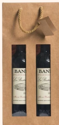
Poche 2 bouteilles 1.50€ HT