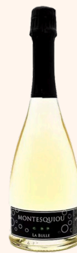
La Bulle extra-brut Vin blanc sec ss sulfite 75cl

Idéal pour les apéritifs d'înatoires, les Fromages à pâtes persillés et le foie gras.