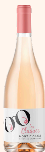
Les Cluques Vin rosé 75cl