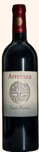
Cuvée Haitza Vin rouge 75cl

Viandes grasses, gibiers, côtelettes à la plancha et porc grillé.