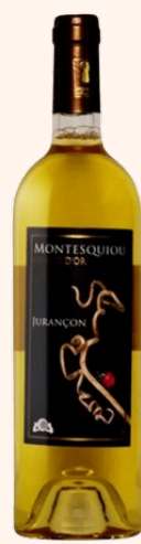
Grappe d'or Vin blanc moelleux 75cl

Idéal pour les apéritifs d'înatoires, les Fromages à pâtes persillés et le foie gras.