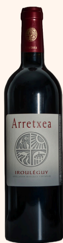
Cuvée Arretxea Vin rouge 75cl

Le Domaine Arretxea est conduit en culture biologique et en biodynamie... Cette démarche exigeante, est passionnante. Elle fait appel aux cycles naturels, aux influences lunaires, à l'observation, aux équilibres naturels, à l'utilisation des plantes