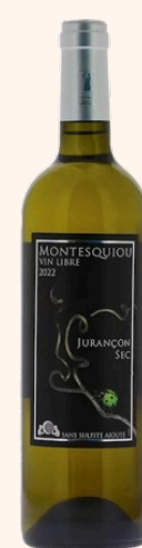
Vin libre Vin blanc sec ss sulfite 75cl

Poissons crus/cuisinés, apéritifs d'înatoires et Fromages.