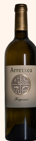
Cuvée Hegoxuri Vin Blanc 75cl

Poissons grillés/crus, viandes blanches en sauce, Foie gras, Fromage.